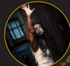
Teatro por la gorra