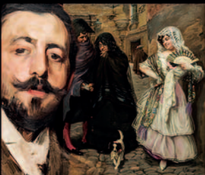
Museo de El Torreón