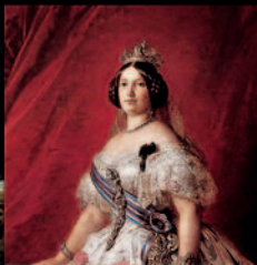
Luces de la Modernidad